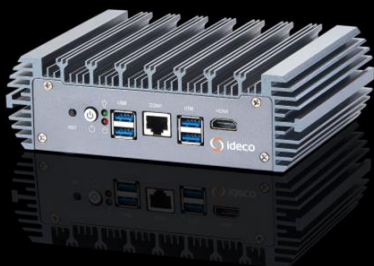
Ideco SX+ Cert