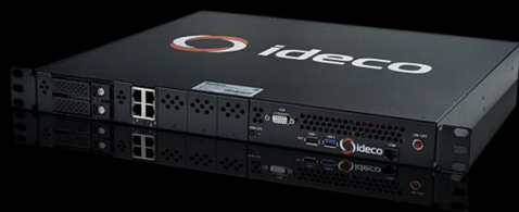
Ideco MX2 Cert