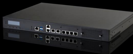
Ideco MX Cert