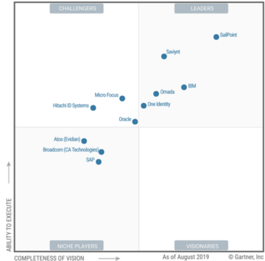
Figure 1. Magic Quadrant for Identity Governance and Administration