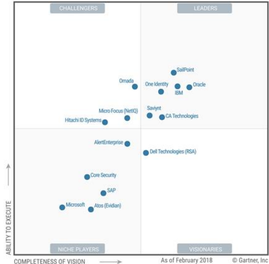
Figure 1. Magic Quadrant for Identity Governance and Administration

Разделение по 4 группам, но отличие в лидерах не определено