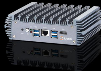
Ideco SX+ Cert