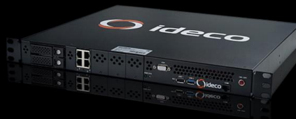
Ideco LX Cert