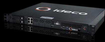
Ideco LX+ Cert